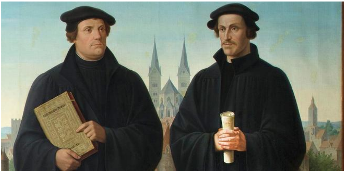
Abbildung 4: Luther und Melanchthon vor dem Augsburger Dom. 113

(47) Karl Ballenberger (1801-1860) verdanken wir ein vierteiliges Ölgemälde, das sich inzwischen im Staatsarchiv Siegmaringen befindet. Die beiden mittleren Gemälde stellen Kaiser Friedrich I. (Barbarossa) mit Gefolge sowie König Rudolf von Habsburg mit seinen Insignien dar. Auf dem linken Bild sind die Augsburger Heiligen Ulrich und Afra zu sehen, während der rechte Teil Martin Luther und Philipp Melanchthon gewidmet ist (vgl. Abbildung 4 ). Mit gutem Recht können wir unsere Reise durch die Voraussetzungen und Ursachen des Europäischen Sonderweges mit einer Betrachtung dieses Bildes beschließen.